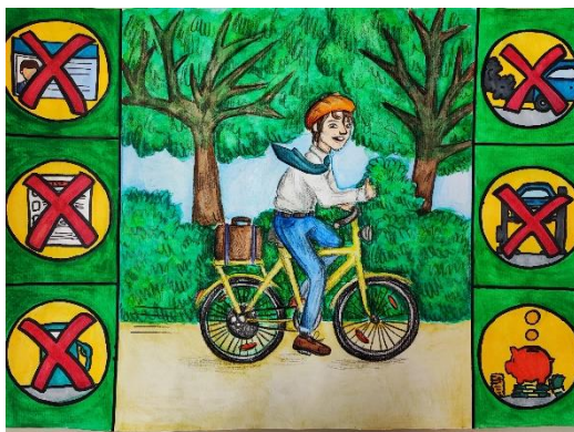
Tisa Julija Golob, 9. a

Eden izmed pomembnih ciljev vzgojno izobraževalnega procesa je učencem privzgajati trajnostno mobilnost kot družbeno vrednoto in jih vsakodnevno spodbujati in navajati k hoji, kolesarjenju, uporabi javnega potniškega prometa in alternativnim oblikam mobilnosti. Olgičarji se trudimo uresničevati komponente trajnostnosti, kot so: povezanost z naravo, ponovne rabe, odgovoren odnos do naravnih virov, povezovanje ljudi in vzpostavljanje blaginje življenja za vse. Cilje in načela trajnostne mobilnosti in trajnostnosti v OŠ Olge Meglič uresničujemo z izvedbo najrazličnejših aktivnosti po vsej vertikali, od 1. do 9. razreda, tako v okviru obveznega kot tudi razširjenega programa (RaP). Šola uspešno sodeluje s Svetom za preventivno in vzgojo v cestnem prometu MO Ptuj (SPVCP), Javno agencijo za varnost prometa (AVP), raznimi zavodi in društvi (ZŠAM) in seveda starši, ki s svojim zgledom pomembno prispevajo k ozaveščanju in uresničevanju trajnostne mobilnosti.