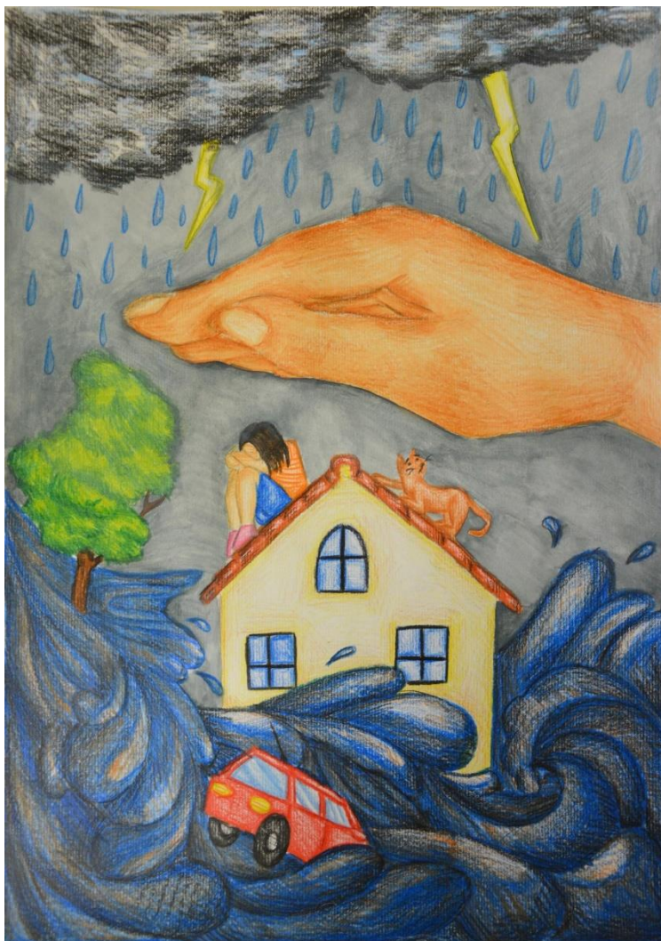
Nagrajena risba likovnega natečaja »Solidarni ob naravnih nesrečah in drugih humanitarnih krizah po svetu« učenke Tise Julije Golob