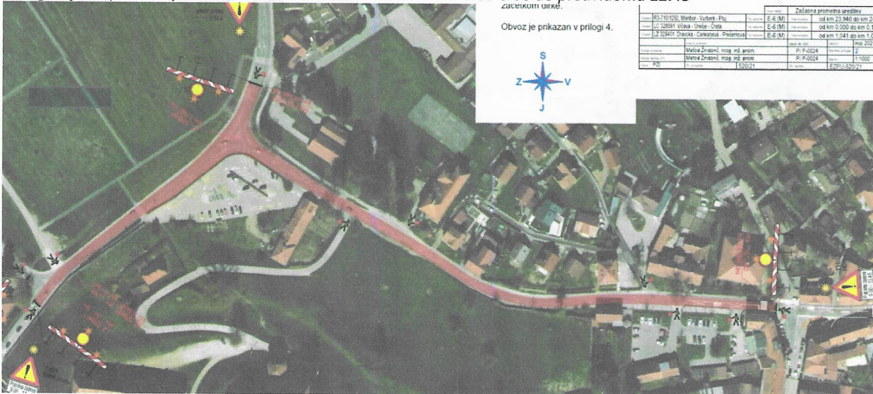
Fotografija: Popolna zapora križišča Raičeve in Maistrove ulice med 8.00 do predvidoma 12.45

Ob 11.00 bo začetek nevtralnega kroga oz. kroga za ogrevanje, ki bo potekal skozi mestno jedro Ptuj in nato mimo Gimnazije Ptuj in bo trajal predvidoma do 11.40. Kolesarji bodo vozili v spremstvu policije in rediteljev organizatorja Dirke po Sloveniji.